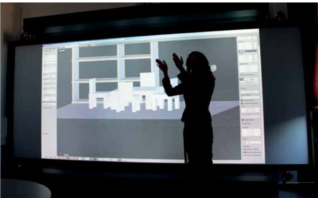
Werbung in eigener Sache: Die HS Bochum setzt die dreidimensionale Darstellung an der smartVR-Wall auch ein, um Schüler für eine technische Ausbildung zu begeistern. Hier mit der 3D-Grafiksoftware Blender.