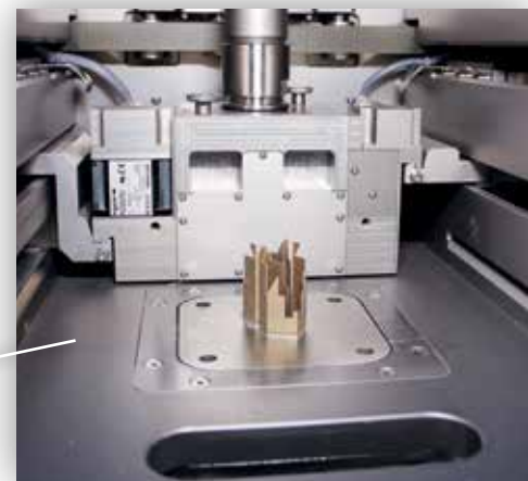
Von der Virtualität in die Realität: In der fakultätseigenen Fab Lab Versuchsfertigung werden die in 3D konstruierten und visualisierten Modelle u.a. mit einer hochmodernen Laser-Schmelz-Anlage im Materialauftragsverfahren produziert.